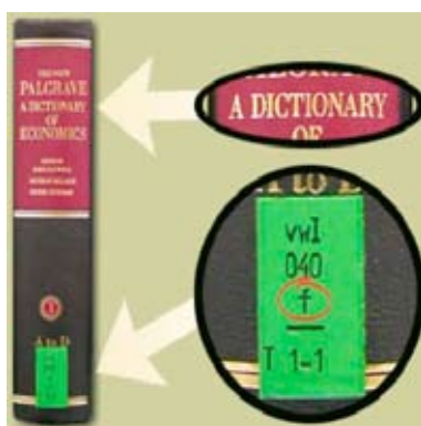
Formschlüssel (f = Lexika, Nachschlagewerke)

Innerhalb der Systemstelle gibt es im ersten Teil der Signatur noch weitere Untergliederungen, die Einfluss auf die Reihenfolge im Regal haben: Buchstaben und Buchstaben-Zahlen-Kombinationen, so genannte „Schlüssel“, die die Bücher nach Form und Inhalt noch weiter kennzeichnen sollen: Formschlüssel (Kleinbuchstaben, z. B. „f“) und Länderschlüssel (Buchstaben-Zahlen-Kombinationen, z.B. „3ke“)