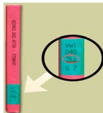
Länderschlüssel (3ke = Grossbritannien)